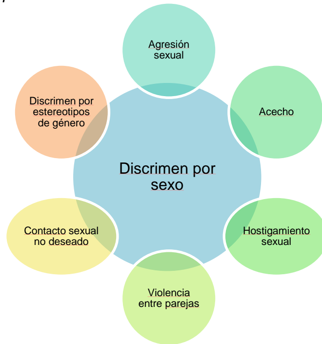
Figura 1: Discrimen por sexo

El 19 de mayo de 2020 fue publicada la nueva regulación del Departamento de Educación de los Estados Unidos sobre el Título IX. Los cambios entraron en vigor el 14 de agosto de 2020. Es responsabilidad de todas las instituciones educativas de revisar sus políticas para alinear las mismas al cumplimiento de esta nueva regulación. El documento final fue publicado en el Federal Register, Vol. 85, No. 97 on Tuesday, May 19, 2020: Rules and Regulations Nondiscrimination on the Basis of Sex in Education Programs or Activities Receiving Federal Financial Assistance .